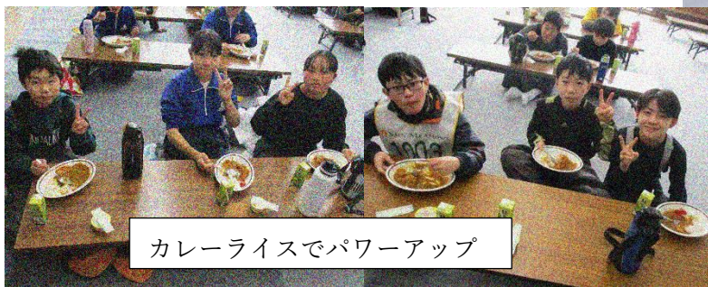
カレーライスでパワーアップ