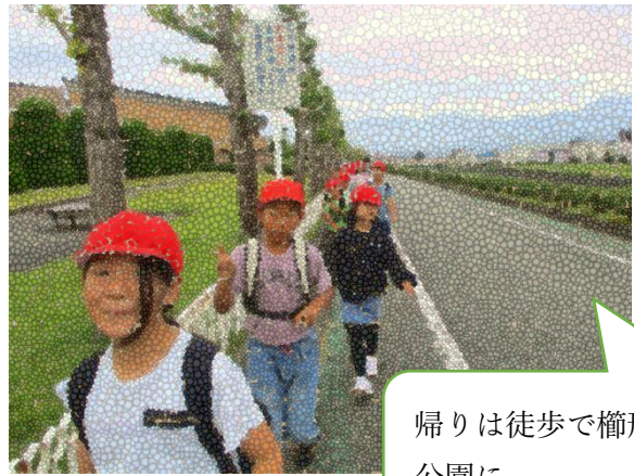
帰りは徒歩で橿形総合公園に