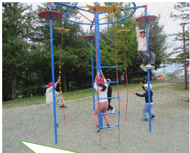
最後は橿形総合公園で遊んで帰りました。