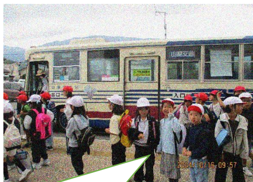
山交バスに体験乗車させていただきました。

楯形にある南アルプス市中央図書館の様子を見学させていただきました。図書館へは、特別に用意していただいた体験乗車券を利用して、コミュニティバス（山梨交通バス）に乗車しました。図書館で働いている方々へたくさん質問も出ました。また、図書館の本を読む・借りる時間もあり、公共施設のマナーを学ぶこともできました。身近な地域から学ぶことができるのは、とても素晴らしいことだと思います。大変お世話になりました。帰りは徒歩で、楯形総合公園に寄って帰ってきました。