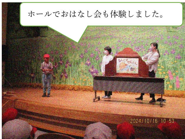
ホールでおはなし会も体験しました。