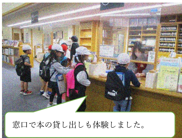
窓口で本の貸し出しも体験しました。