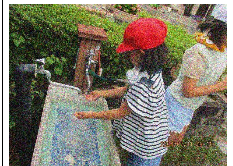
井戸水（右側）と水道水（左側）の違いを両手で比べました。