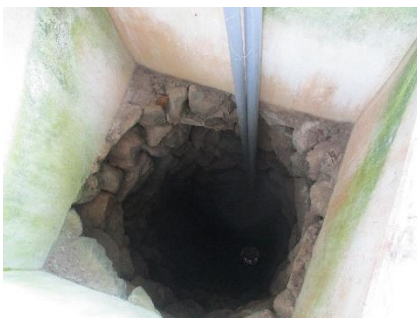
井戸の奥には自分たちの姿が小さく映っています