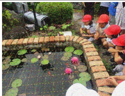
井戸水を使ったきれいな池