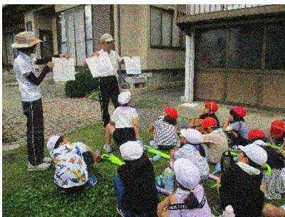
パネルで井戸の様子を説明していただきました

また、畑を通るときには、大事に世話をしている梨や桃の様子も教えていただきました。貴重な体験をさせていただきました、ありがとうございました。