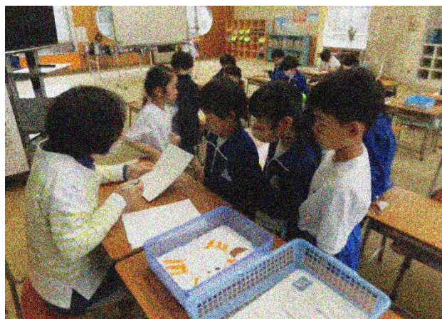
1年生 図工「すきなもの なあに」