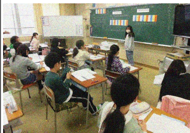
4年1組 算数「千万より大きな数」