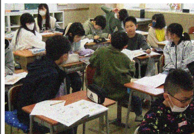
5年生 道徳「今度こそ」