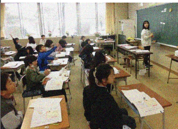
2年生 道徳「大せつなこと」