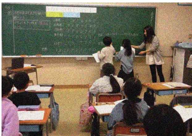
4年2組 算数「千万より大きな数」