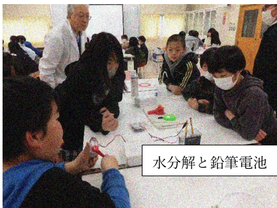
水分解と鉛筆電池

4年生は環境学習に取り組んできました。山梨大学から講師（客員教授）を招聘し、出前授業を行っていただきました。エネルギーや地球温暖化から燃料電池に至るまでクイズや実験を通して楽しく学ぶことができました。この学習は、市環境課、市議会議員の方々の御提案と御協力で実現しました。子ども達のために、よい機会をありがとうございました。