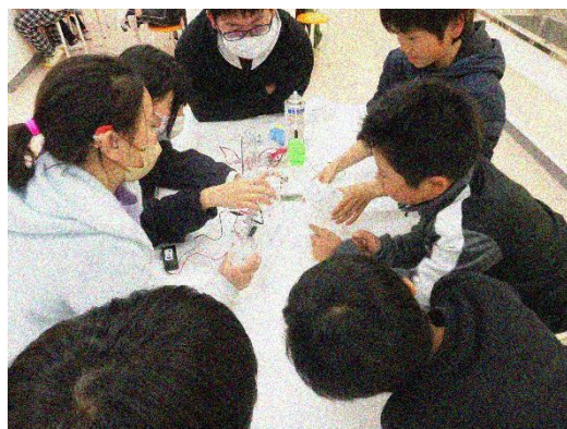
燃料電池発電実験