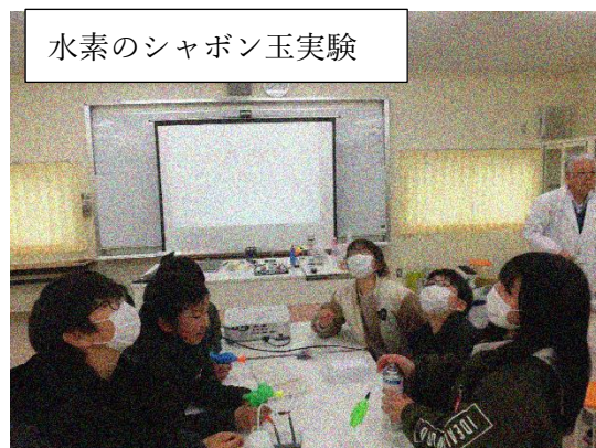
水素のシャボン玉実験