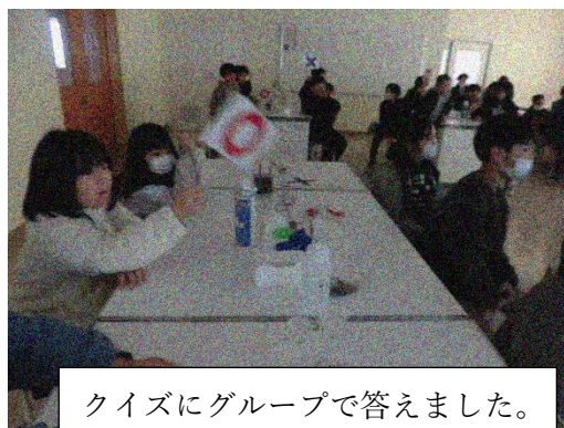
クイズにグループで答えました。