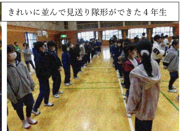
きれいに並んで見送り隊形ができた4年生