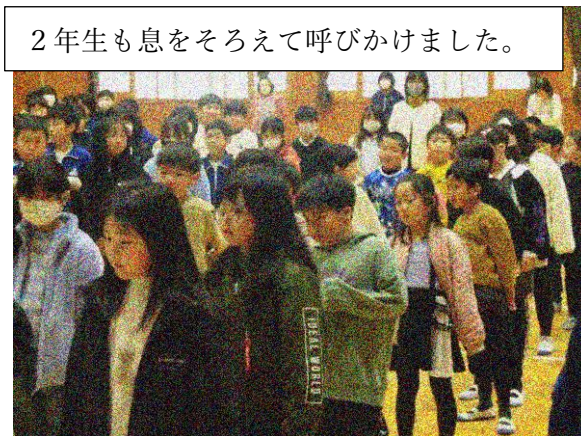
2年生も息をそろえて呼びかけました。