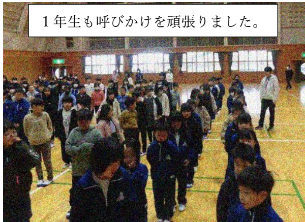
1年生も呼びかけを頑張りました。