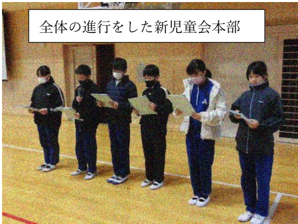
全体の進行をした新児童会本部

北小タイムに1～5年生が集まり、送る会の練習をしました。各学年の呼びかけと6年生を送りだす隊形に広がる練習です。最初の呼びかけは、声やタイミングが合わないこともあったのですが、2回目の練習でよくなってきました。新児童会の進行も上手にできました。