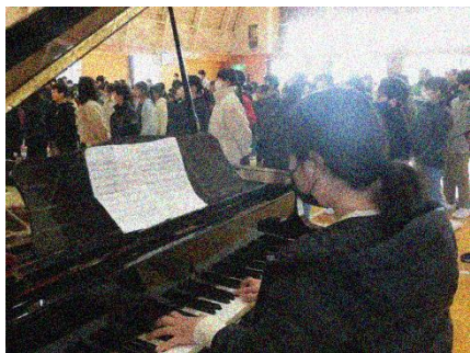
校歌斉唱：6年生が伴奏しました。元気よく歌いました。

始業式に臨む子どもたちの顔つきや姿勢からやる気と意気込みを感じることができました。素晴らしいスタートになりました。