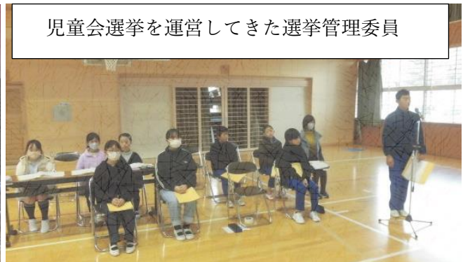
児童会選挙を運営してきた選挙管理委員