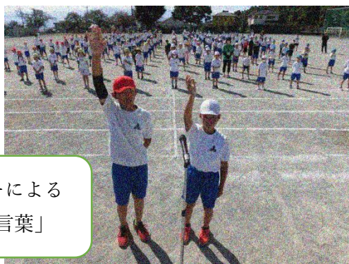
色リーダーによる 「誓いの言葉」