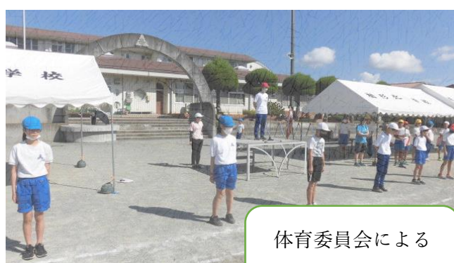
体育委員会による ラジオ体操