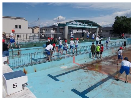
5・6年生 プール清掃