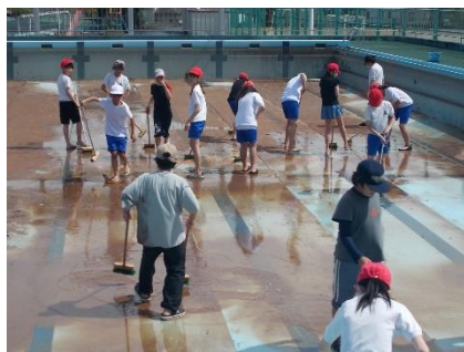
一生懸命こすりました。