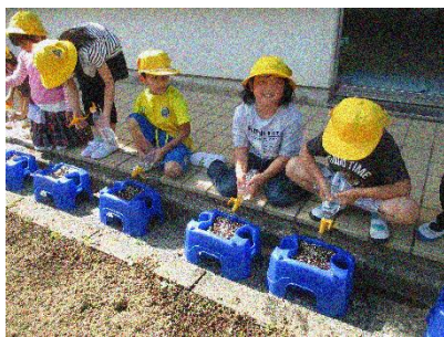
1年生 アサガオの観察，北小タイム

5月は、30度を超える日が続いたり、冷たい雨の日があったりと、気温の差が大きく変化しましたが、子どもたちは元気に活動できました。各学年で計画していた行事や見学なども順調に行われ、生き生きとした姿を見ることができました。