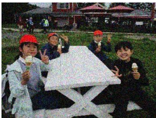
ソフトクリームに笑顔