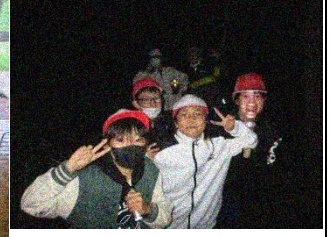
ナイト追跡も怖くない！