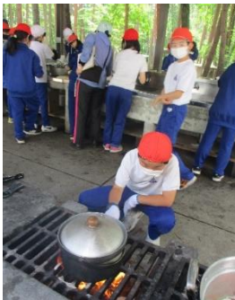
自分の仕事を頑張ります