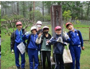
頂上までもう少し