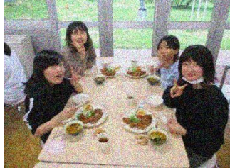
夕飯をいただきます