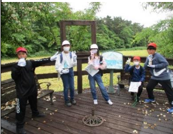
絵図ハイクの休憩地点