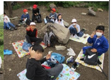
お弁当も最高です