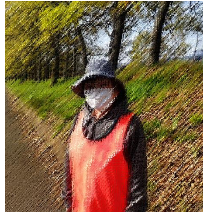
校庭南西側での安全指導