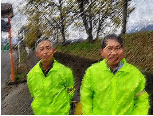
校門前での安全指導

いきいきクラブ・協議体・スクールガードリーダー・保護者の皆様にご協力いただき、朝の登校を見守っていただいております。校長、教頭が代わり、なかなか対応ができず、すみませんでした。この他にも様々な場所で児童の安全指導を行ってくださっていると伺っております。本当にありがとうございます。