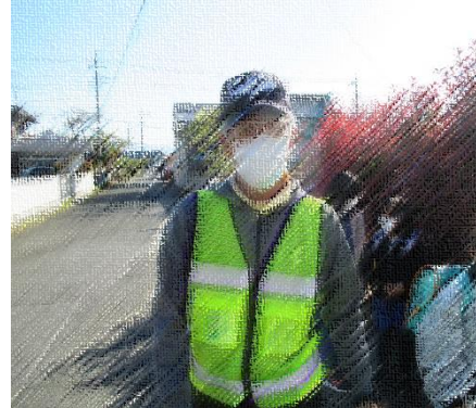
桃園点滅信号での安全指導