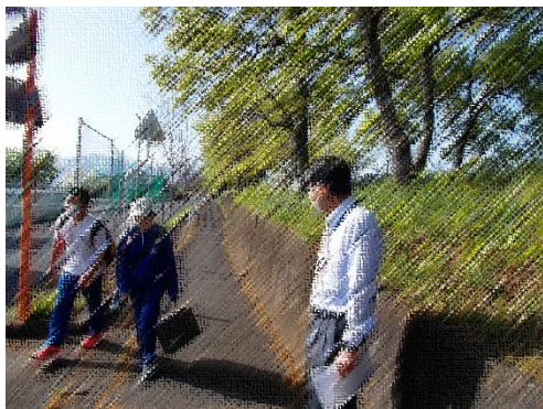
スクールガードリーダーの見守り(4月17日より)

また、一年生の下校に際して、家の近くまでお迎えに来ていただいている保護者の方々ありがとうございます。お陰様で、一年生も登下校にも慣れてきたようです。