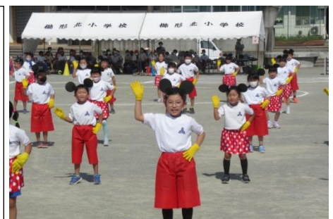
昨年の運動会より