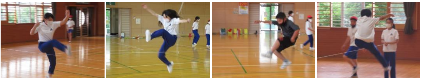
給食も七夕でした

6年生は体育館で走り高跳びに挑戦していました。バーの代わりにゴムを使い、子どもたちの恐怖心を軽減して練習を行っていました。なかなかいいフォームで跳び越している子もいましたよ。