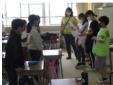
高学年はいわゆる「命令ゲーム」大勢の人が引っかかっていました(^_^)