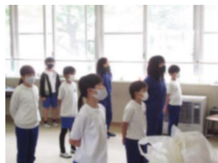
ゲームの後は校歌の練習です。マスクをつけたまま、声を張らずに歌います。