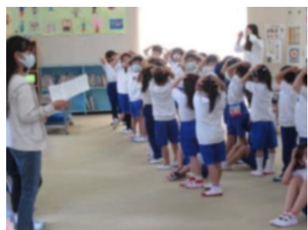
1年生は「落ーちた落ちた」の声に合わせて身体表現。みんな上手です。

一昨年度まで「歌声タイム」として実施してきた朝の音楽活動ですが、感染症対策で合唱の実施が難しいことも考えられるため、名称を「音楽タイム」とし、歌だけでなくリズム遊びも取り入れながら学年ごとに活動しています。今年は秋の「ドレミファ発表会」も、何らかの形で実施できるよう、現在検討中です。